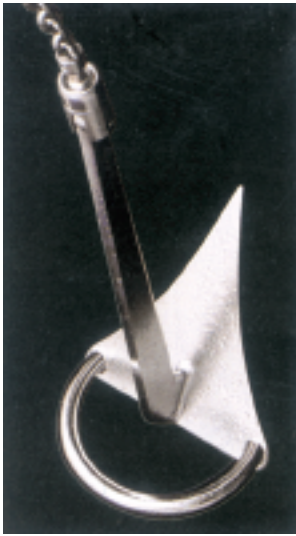
El ancla con estribo de acero inoxidable está disponible con el nombre grabado. Solicite precio.