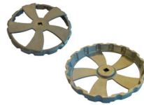
9998 colocación máquina eléctrica