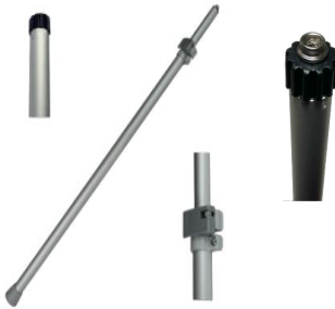
9997-1 Tensor funda Ø19 mm en aluminio anodizado graduable de 86 a 150 cm. Resiste hasta 75 kg.