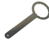
9999 colocación manual