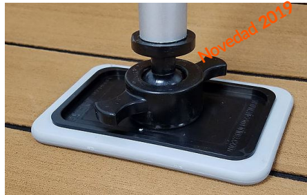
9996-2 Base basculante