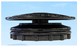
9991 BoatVent 3 negro