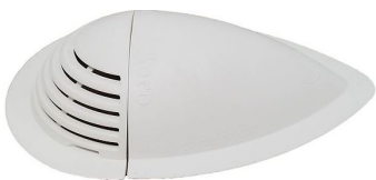
9804 Respiradero 2 piezas (para coser) Color blanco