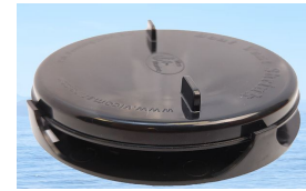
9900 BoatVent 3 negro R1 solo uso para fundas de invernaje

Herramientas y troqueles que facilitan la colocación del Boat Vent