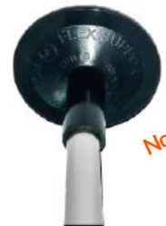
9905 Soporte Flex . Sostiene la cubierta del barco, se adapta al borde de la punta para una costura opcional