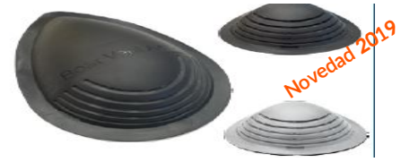
9908 Negro 9909 Blanco Respiradero 1 pieza largo 27,3 x 19,7 x 5,1