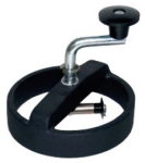
9997 Troquel corte manual

Herramientas y troqueles que facilitan la colocación del Boat Vent